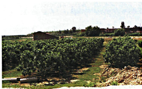
Figura 1. Cultivo de higuera en regadío en Alguaire.

plantación regular en España asciende a 19.250 ha y el número de árboles diseminados se aproxima a 600.000. En el año 2002 la producción total fué de 41.130 tn. Las principales Comunidades Autónomas productoras son: Baleares, Extremadura, Comunidad Valenciana y Andalucía (MAPA, 2004).