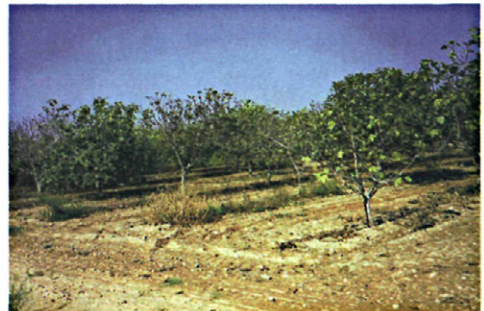
Figura 2. Colección de variedades de la Fundació Más Bové (IRTA, Tarragona).

Simultáneamente se evaluó la cantidad de mosaico en tres colecciones de variedades. En septiembre de 2001 se muestrearon las colecciones de Cataluña de la Fundació Más Bové (Estación Experimental del IRTA a Reus, Tarragona) (Figura 2) y de Corbins (Estación Experimental del IRTA a Lleida).